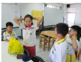
觀察長頭髮的人如何戴泳帽